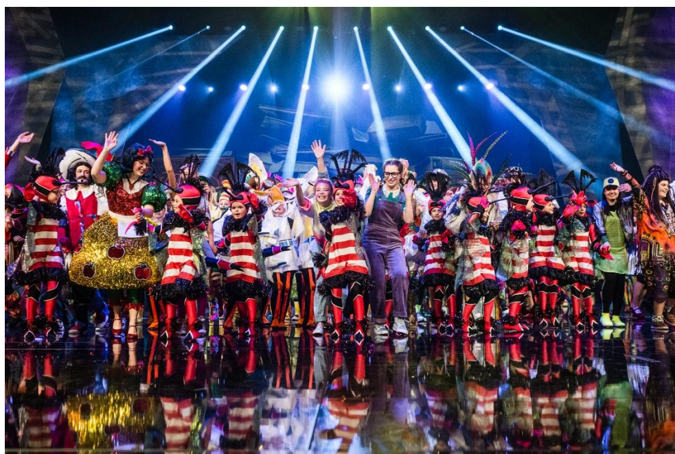
Das junge Ensemble des FriedrichstadtPalastes Berlin

Nach exakt 1.034 langen Tagen stehen die Kinder und Jugendlichen des jungen Ensembles am Sonnabend endlich wieder vor Publikum auf der riesigen Palastbühne: Deutschlands aufwändigste Young Show ‚Im Labyrinth der Bücher‘ feiert am 19. November mit ausverkaufter Premiere das heißersehnte Comeback. Die spektakuläre Neufassung wurde an vielen Stellen neugestaltet - mit neuen Bühnenbildern und Choreografien. Über 100 Kinder und Jugendliche pro Vorstellung übernehmen in zwei voneinander unabhängige Besetzungen alle Rollen inklusive der Hauptrollen und der artistischen Darbietungen - im Hinblick auf Bühnendimensionen und Ausstattungsaufwand selbst weltweit einzigartig.