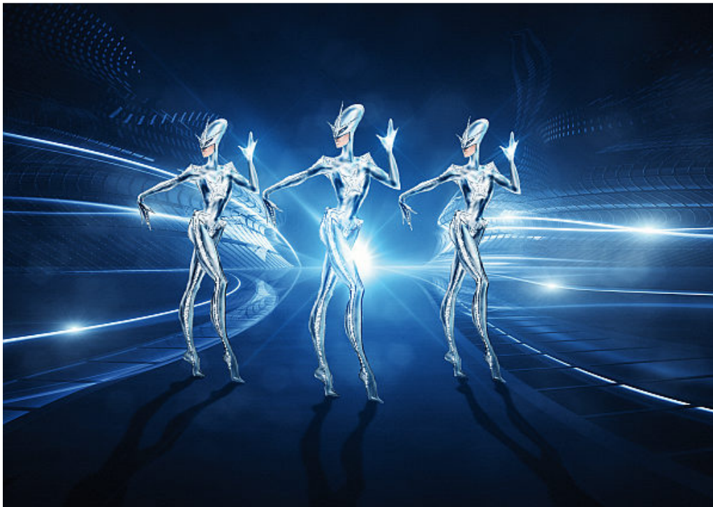
Alien kickline | Illustration de Manfred Thierry Mugler | Dessins © Stefano Canulli

Ils sont parmi nous. Tous ceux qui se laissent parfois emporter vers des univers parallèles de la nuit berlinoise le pressentent. Des formes de vie de toutes les couleurs sont irrésistiblement attirées par l'atmosphère de comédie musicale « anything goes » qui règne dans cette ville. Parmi ces créatures, un amateur de BMX et une lady farouche qui habite en haut de la tour de télévision, plus attirée par la compagnie des extraterrestres que par celle des habitants de la Terre. Deux âmes que tout rapproche, mais aussi que tout sépare. En effet, un amour entre le Ciel et la Terre doit s'affranchir des lois de la nature. Pour ce faire, il faut s'adjoindre l'aide de puissances supérieures telles que Néfertiti, probablement la Berlinoise la plus célèbre au monde. Son nom signifie « la belle est venue » et l'un de ses titres royaux signifie, comme un présage, « la Grande du Palast ». Mais d'où vient-elle vraiment ? Et d'où vient cette jeunesse qu'elle garde depuis 3400 ans ?